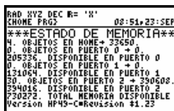
Pantalla 3: estado de memoria y versión ROM