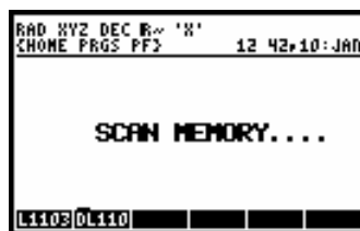
Pantalla 2: scan de memoria