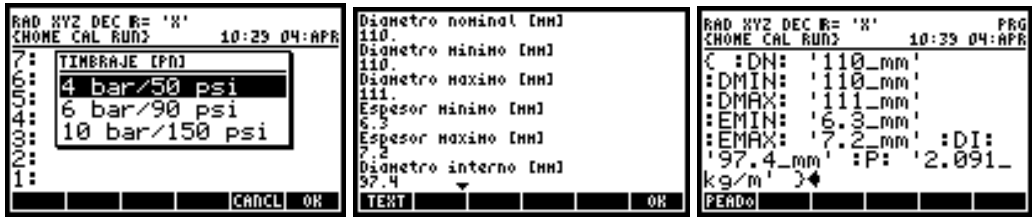
Ilustración 2: timbraje tubería, salida de propiedades